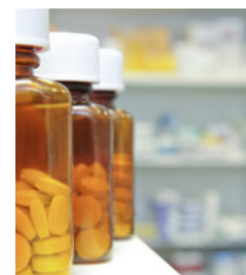
Volně prodejné léky