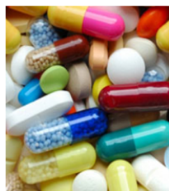
Všechny registrované léky

Hledáte aktuální, úplné a ověřené informace o léčivých přípravcích? SÚKL Vám zpřístupňuje přehlednou databázi léčivých přípravků a potravin pro zvláštní lékařské účely, které jsou registrované v České republice. A dále databázi, která obsahuje pouze volně prodejné léčivé přípravky, v té si můžete vybrat lék podle typu Vašich potíží.